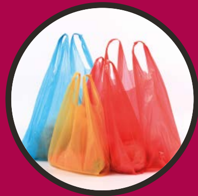
buste della spesa