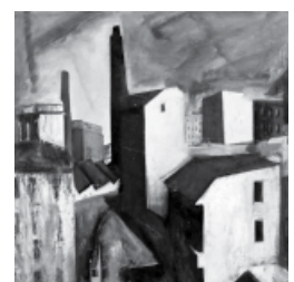
► paesaggio / Mario Sironi