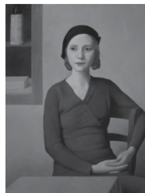
► ritratto / Antonio Donghi